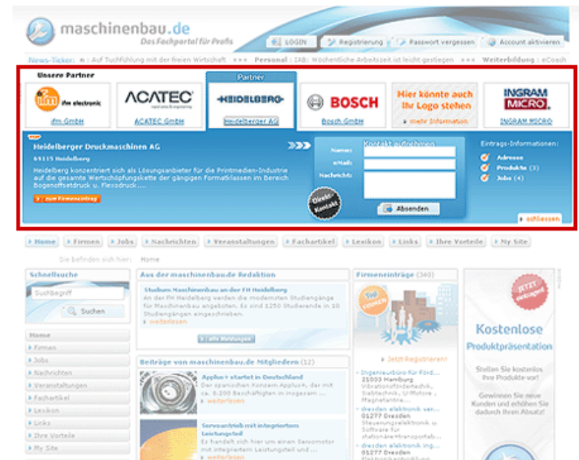
Abb. 1 | Partner-Eintrag im Header-Bereich